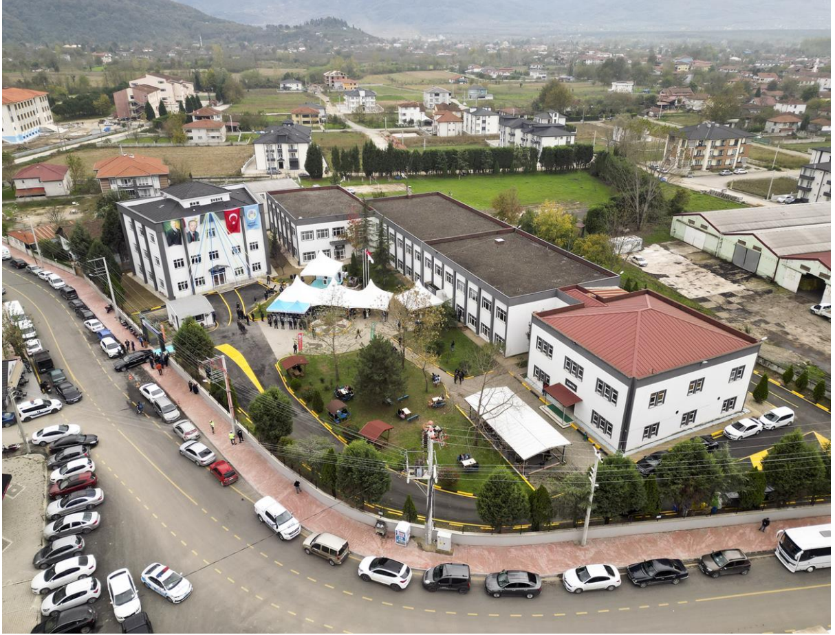
Şekil 1. SUBÜ Sağlık Bilimleri Fakültesi

Öğrencilerimizin iş dünyasının beklentilerini karşılayacak bilgi ve uygulama becerisine sahip sağlık profesyonelleri olarak yetişmelerini sağlamak için, eğitim müfredatımız yedi dönemi okulda teorik ve uygulamalı dersler, bir dönemi de işletmelerde uygulama olarak düzenlenmiştir. Fakültemizde dersliklerimiz, kantin, yemekhane, kütüphane, mesleki klinik beceri laboratuvarı, iletişim laboratuvarı, sağlıklı yaşam ve egzersiz laboratuvarı, elektroterapi laboratuvarı, ısı-ışık laboratuvarı ve bilgisayar laboratuvarı bulunmaktadır.