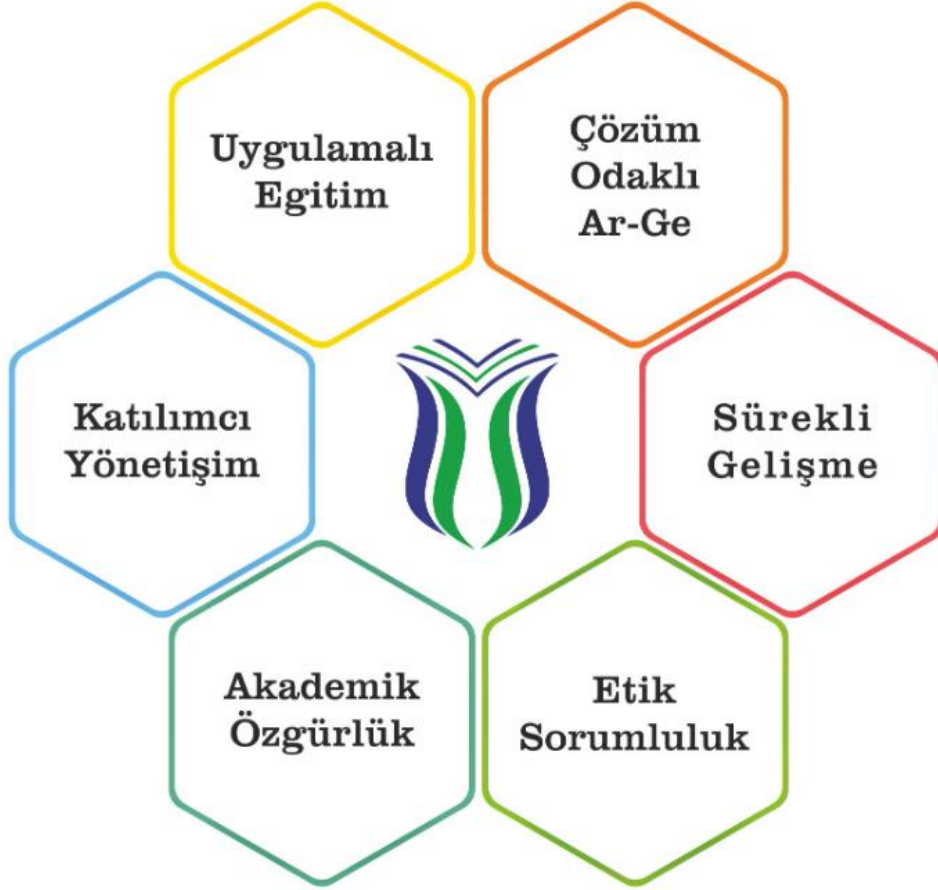
Şekil 2. Temel Değerlerimiz